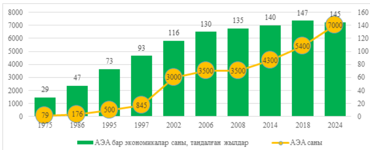
Сурет 1 – АЭА-дағы тарихи тенденция

Арнайы экономикалық аймақтардың (АЭА) қалыптасу тарихы бірнеше ғасыр бұрын пайда болған еркін порттар идеясынан бастау алады. Алғашқы кезеңдерде саудагерлер порт аумақтарында жергілікті биліктің тікелей араласуынсыз тауарларды өңдеп, қайта экспорттаумен айналысқан. Қазіргі мағынадағы арнайы аймақтар теңіз порттары, әуежайлар мен шекаралық көлік дәліздеріне жақын орналасқан аумақтар ретінде XX ғасырдың 1960 жылдарынан бастап қалыптаса бастады. 1980 жылдары АЭА санының жедел өсуі экспортқа бағдарланған индустриялық даму стратегияларының кең таралуымен, әсіресе Азия елдерінде, сондай-ақ ірі халықаралық компаниялардың оффшорлық өндірісті белсенді пайдалануымен байланысты болды. Ал 1990-жылдардың соңы мен 2000-жылдардың басында жаһандық өндірістің ұлғаюы және халықаралық өндіру-өткізу тізбектерінің қарқынды дамуы жаңа арнайы аймақтар толқынының пайда болуына ықпал етті. Бұл кезеңде көптеген дамушы мемлекеттер табысты елдердің тәжірибесін қайталауға ұмтылды. Алайда әлемдік қаржы дағдарысы мен халықаралық сауданың баяулауы АЭА құру қарқынын уақытша тежеді. Қазіргі кезеңде жаһандану үдерісінің баяулауы керісінше әсер етіп, үкіметтер өнеркәсіптік капитал үшін бәсекені күшейту мақсатында жаңа форматтағы АЭА құруға бет бұруда. Бүгінгі таңда әлемде шамамен 7000 арнайы экономикалық аймақ жұмыс істейді, олардың елеулі бөлігі соңғы бес жыл ішінде құрылған.