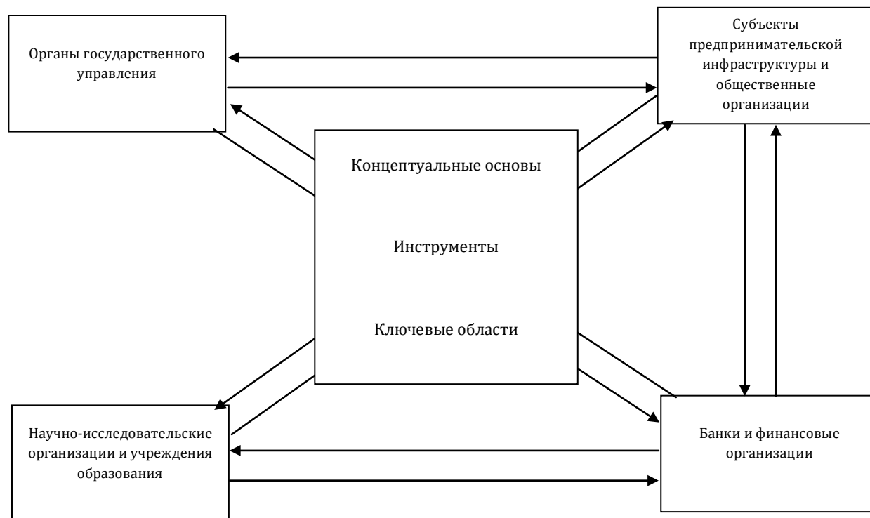
Рисунок 3 – Общая схема институциональной модели поддержки женского предпринимательства в Республике Беларусь