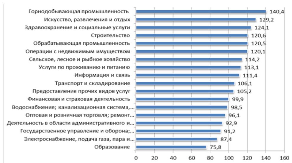
Рисунок 2. Темпы роста инвестиций по отраслям в 2018 г. в Республике Казахстан, в % к 2017 г.

Добывающая отрасль лидирует не только по объему привлеченных инвестиций, но и по темпам роста. В 2018 г. в этот сектор вложено на 40,4% больше средств, чем в 2017 г. (рисунок 2).