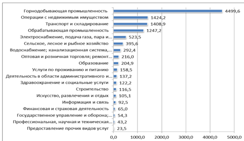
Рисунок 1. Структура инвестиций по отраслям в 2018 г. в Республике Казахстан, в млрд. тенге (составлено автором на основе [5])

По общему объему привлеченных инвестиций традиционно лидирует горнодобывающая отрасль – сюда в 2018 г. направлено 4,5 трлн. тенге (это более 40% всех инвестиций) (рисунок 1).