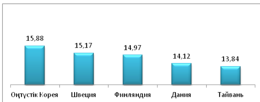
Сурет 4 – 2019 жылғы елдер арасындағы 1000 жұмысшыға шаққандағы ғалымдар мен зерттеушілер саны

Қазақстанда креативті экономиканы қалыптастырушы шығармашылық тұлғаларға өз идеяларын дамыту қиынға соғуда. Себебі, елімізде шығармашылық идеяларды қаржыландыру жүйесі төмен деңгейде тұр. Осы саланың дамуына, оның ішінде әртүрлі шығармашылық өнімдер мен стартаптарды қолдау және дамытудың мемлекет тарапынан арнайы бағдарламасы жасалуы тиіс. Өз кезегінде мемлекет саланы қолдай отырып, әртүрлі әлеуметтік-экономикалық мәселелердің шешімін табуға, саланың дамуына мүмкіндік береді. Осындай қолдаулардың бірі – АҚШ мысалындағы кәсіпкерлік қызметке салынып отырған салықтардың төмен өлшемі. Үкімет креативті кәсіпкерлікке төмен салықтар