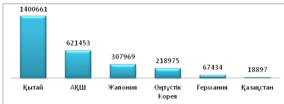
Сурет 3 – Патенттер саны бойынша әлем елдерінің рейтингі және Қазақстан

3-суреттегі диаграммада World Intellectual Property Organization ұйымының 2020 жылы жарияланған патенттер саны бойынша әлем елдерінің алғашқы бестігі көрсетілген. Патенттер алуға жалпы берілген өтінімдер бойынша алғашқы бестікке Азия-Тынық мұхиты аймағының 3 елі кіреді: 1400661 өтініммен Қытай, 307969 өтініммен Жапония және 218975 өтініммен Оңтүстік Корея. Рейтингте екінші орынды Америка