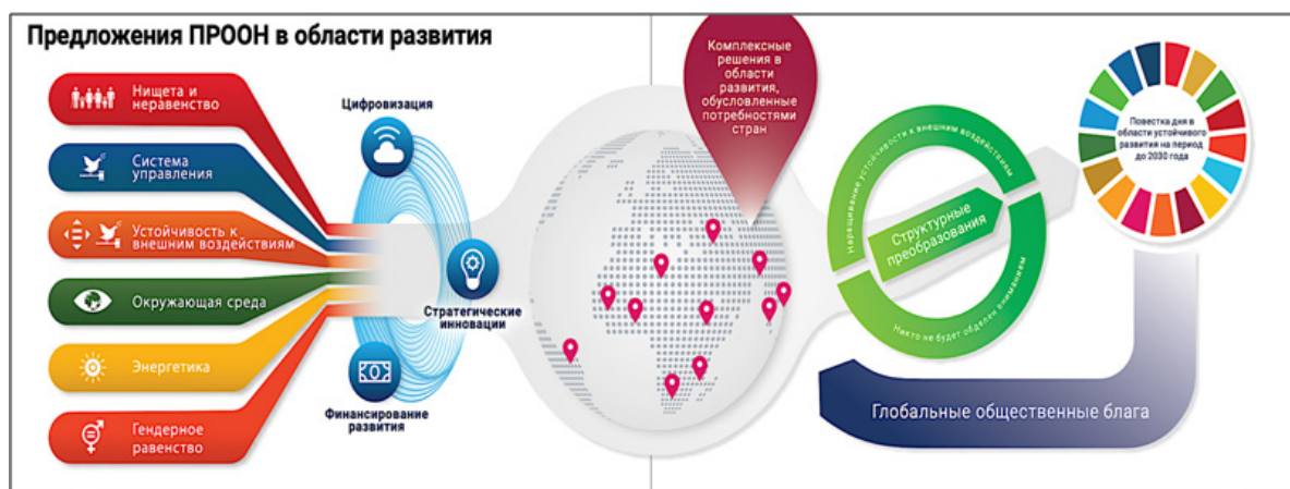
Рисунок 3 – Предложения ПРООН в области устойчивого развития стран

Меры же, принимаемые для диверсификации экономики, способствуют устойчивому развитию и инклюзивному росту страны. Также совершенствуются производственные мощности, разрабатываются более эффективные и инновационные методы рациональному потреблению и принимаются новые технологии в области управления отходами [9].