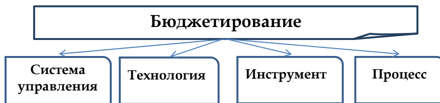
Рис. 1. Разночтения понятия «бюджетирование»