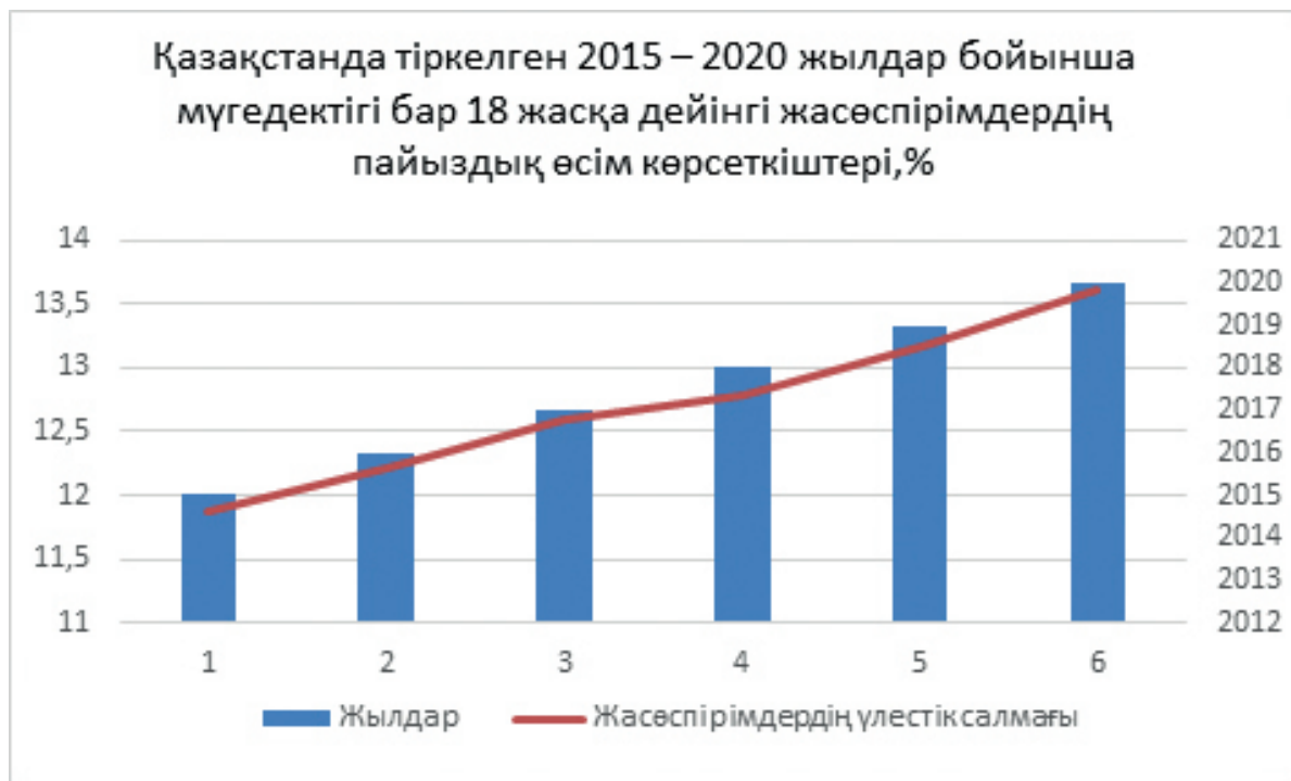
Сурет 4 – Қазақстанда тіркелген 2015 – 2020 жылдар бойынша мүгедектігі бар 18 жасқа дейінгі жасөспірімдердің пайыздық өсім көрсеткіштері, %

Ескертпе –ҚР ҰСБ мәліметтері негізінде автормен құрастырылған