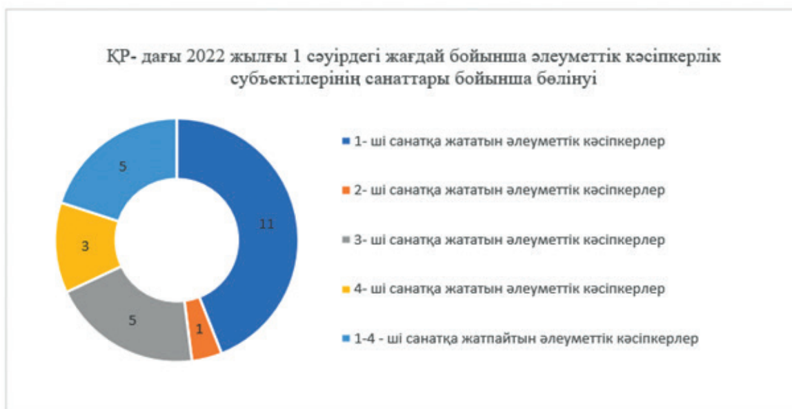
Сурет 5 – ҚР-дағы 2022 жылғы 1 сәуірдегі жағдай бойынша әлеуметтік кәсіпкерлік субъектілерінің санаттары бойынша бөлінуі

Жалпы тіркелген әлеуметтік кәсіпкерлер саны – 25 субъекті, оны 100% деп алсақ, соның ішінде: 1- ші санатқа жататын әлеуметтік кәсіпкерлер саны – 11, яғни 44%, 2 - ші санатқа жататын әлеуметтік кәсіпкерлер – 1 кәсіпкер, 4%, 3 - ші санатқа жататын әлеуметтік кәсіпкерлер саны-5 кәсіпкер, 20%, 4 - ші санатқа жататын әлеуметтік кәсіпкерлер -3 кәсіпкер, 12%-ды құрайды және 1-4 - ші санатқа жатпайтын әлеуметтік кәсіпкерлер саны 5 субъекті, 20%-ды құрайды.