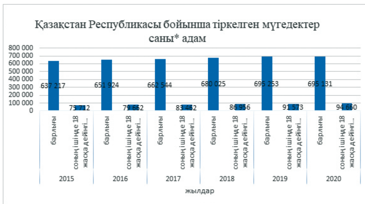
Сурет 3 – Қазақстанда тіркелген 2015 – 2020 жылдар бойынша мүгедектер саны, адам Ескертпе –ҚР ҰСБ мәліметтері негізінде автормен құрастырылған

Қазақстанда мүгедектігі бар азаматтарға арналған өнімдер өндірісі мен осы саладағы сервистік қызмет, әлеуметтік мәселелердің екінші бағыты бола отырып, осы саладағы қиындықтарды азайтуға мүмкіндік береді.