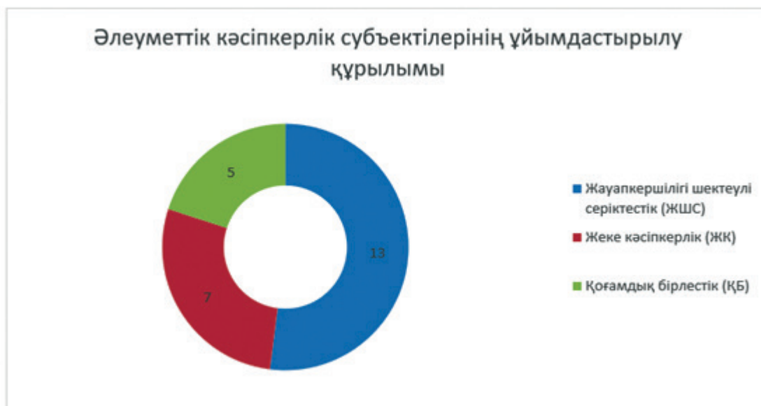
Сурет 6 – ҚР-дағы 2022 жылғы 1 сәуірдегі жағдай бойынша әлеуметтік кәсіпкерлік субъектілерінің ұйымдастырылу құрылымы

ҚР - дағы 2022 жылғы 1 сәуірдегі жағдай бойынша әлеуметтік кәсіпкерлік субъектілерінің ұйымдастырылу құрылымы бойынша талдау жасасақ, жалпы саны – 25 субъект, яғни 100% деп алсақ, соның ішінде: жауапкершілігі шектеулі серіктестік (ЖШС) негізінде құрылғандар саны – 13 кәсіпорын, жеке кәсіпкерлік (ЖК) негізінде құрылғандар саны – 7 кәсіпорын, қоғамдық бірлестік (ҚБ) негізінде құрылғандар саны – 5 кәсіпорынды құрайды. Жоғардағы кестеде көрсетілгендей, жалпы әлеуметтік кәсіпкерлік субъектілерінің жауапкершілігі шектеулі серіктестік (ЖШС) негізінде құрылғандардың үлесі – 52%, жеке кәсіпкерлік (ЖК) негізінде құрылғандардың үлесі – 28%, қоғамдық бірлестік (ҚБ) негізінде құрылғандардың үлесі – 5% - ды құрайды.