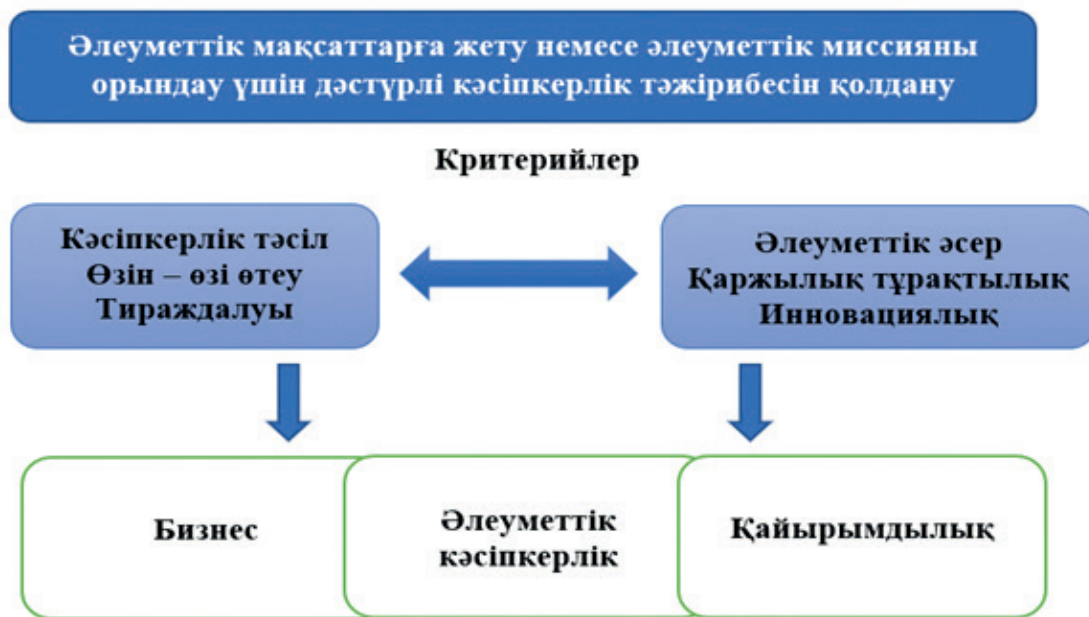
Сурет 2 – Әлеуметтік мақсаттарға жету немесе әлеуметтік миссияны орындау Ескерту – Авторлармен құрастырылған

Кез-келген елдің экономикасы үшін әлеуметтік кәсіпкерлікті дамытудың пайдалы тиімділігі: әлеуметтік жағдайларды шешу, жаңа немесе бұрын қолданыста болмаған экономикалық ресурстарды іздеу, қоршаған ортаны ластау мәселесін қарастыру, жұмысбастылықты арттыру, аз қамтылған отбасылардың санын азайту, мүгедектігі бар тұлғаларды жұмыспен қамту, балалар тәрбиесі мен денсаулығын жақсарту және т.б. Осы тұрғыда әлеуметтік кәсіпкерлікте инновациялық идеяларды жүзеге асыру қажет болады.