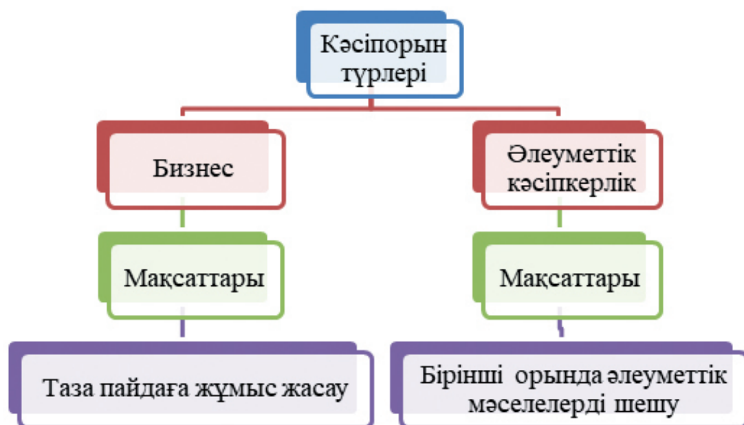
Сурет 1 – Әлеуметтік кәсіпкерлік пен кәсіпорынның түбегейлі ерекшеліктері

Жалпы Қазақстандағы әлеуметтік кәсіпкерлік субъектілерін тіркеудің алғашғы жұмысын 2019 жылы ҚР - ның Ақпарат және қоғамдық даму министрлігі жүргізген. Анықталған есептемелерге сәйкес, 2019 жылы Қазақстандағы әлеуметтік кәсіпкерлік субъектілернің саны – 152 субъекті. Қазақстанда 2021 жылдың шілде айы есебі бойынша салық жеңілдіктерін пайдаланушы әлеуметтік кәсіпкерлік субъектілері – 105 кәсіпорын болып отыр. 2021 жылы алғаш рет «Әлеуметтік кәсіпкерлік» ұғымы енгізілді. «Әлеуметтік кәсіпкерлік» туралы Заң 1 қаңтар 2022 жылдан бастап күшіне енді. Бұл Заң жобасы қабылданғанға дейін, заңды қабылдауға дайындық жұмыстары жүргізіліп, әлеуметтік кәсіпкерлердің реестрін құру тәртібі, әлеуметтік кәсіпкерлік статусын берудегі өңірлік комиссияларды құру тәртібі мен олардың жұмыстары, әлеуметтік кәсіпорындарды құрудағы басты талаптар мен әлеуметтік кәсіпкерлікті қолдауды іске асырудың тәртібі дайындалды.