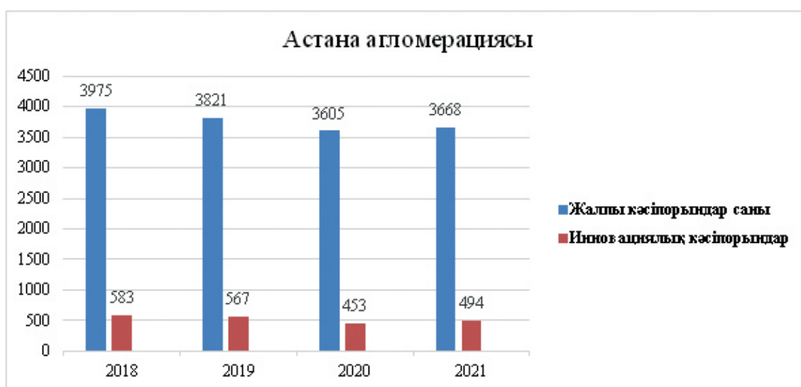
Сурет 3. Астана агломерациясы бойынша кәсіпорындар саны

Астана агломерациясы – екінші ірі агломерация 1,2 миллионнан астам халық тұрады. Бірақ олардың басым көпшілігі Астана қаласында тұрақты тұрады. Астана агломерациясы экономикасының негізі: қызмет көрсету саласы, көтерме және бөлшек сауда, көлік және байланыс, құрылыс, өнеркәсібіне негізделген [7]. Астана агломерациясы бойынша жалпы кәсіпорындар саны мен инновациялық кәсіпорындар саны 3-суретте көрсетілген. 2018 жылғы кәсіпорындар саны 3975 болды, инновациялық кәсіпорындар үлесі 583-ті құрады. 2019 жыл бойынша жалпы кәсіпорындар саны 3821, оның ішіндегі инновациялық кәсіпорындар үлесі 567, ал 2020 жылы жалпы кәсіпорындар саны 3605-ке қысқарып, инновациялық кәсіпорындар үлесі 453-ті құрады.