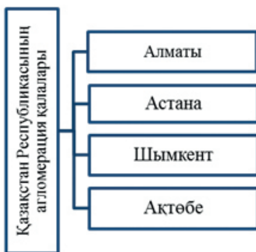
Сурет 1. Агломерация қалалары

Сонымен, агломерациялық қалаларды жаңа технологиялар, ғылым негізінде тұрақты экономикалық өсуге және инновациялық дамытуға болады. Қазіргі таңда Қазақстан Республикасында 4 агломерациялық қалалар қалыптасып, даму үстінде (1-сурет). Осы агломерациялық қалалардың және еліміздің даму ерекшеліктеріне сәйкес тоқталып, жоғарыда айтылған көрсеткіштер негізінде талдайтын боламыз.