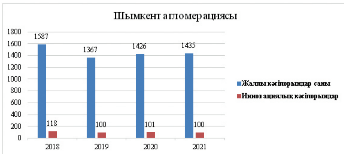
Сурет 4 – Шымкент агломерациясы бойынша кәсіпорындар саны

Шымкент агломерациясы – республиканың ірі өнеркәсіптік, сауда және мәдени орталықтарының бірі. Ауданда қалалар мен елді мекендердің саны бойынша екінші және ауданы бойынша Қазақстандағы бірінші агломерацияны құрайды. Шымкент – Қазақстанның жетекші өнеркәсіптік және экономикалық орталықтарының бірі. Қалада түсті металлургия, машина жасау, химия, мұнай өңдеу және тамақ өнеркәсібі салаларына маманданған [7]. Шымкент агломерациясының қалалары мен елді мекендерінде ішкі және сыртқы ауыл шаруашылығы өнімдерін қайта өңдеуге маманданған. Шымкент агломерациясы бойынша жалпы кәсіпорындар саны мен инновациялық кәсіпорындар саны 4-суретте көрсетілген. 2018 жылы кәсіпорындар саны 1587-ні құрады, оның ішінде 118-і инновациялық кәсіпорын, ал 2019 жыл бойынша кәсіпорындар саны 1367-ге төмендеген, ал инновациялық кәсіпорындар саны 100-ді құраған. 2020 жыл бойынша кәсіпорындар саны 1426, оның ішінде инновациялық кәсіпорындар 101.