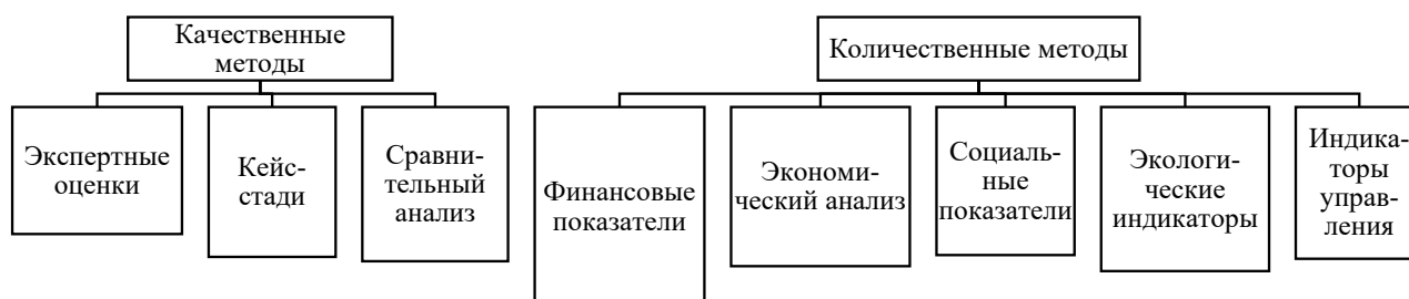
Рисунок 1. Качественные и количественные методы оценки эффективности государственной собственности.

Как известно, во время проведения анализа какого-либо процесса проводят оценку как количественных, так и качественных показателей. При оценке эффективности государственной собственности также можно классифицировать методы на качественные и количественные, которые показаны на рисунке 1.