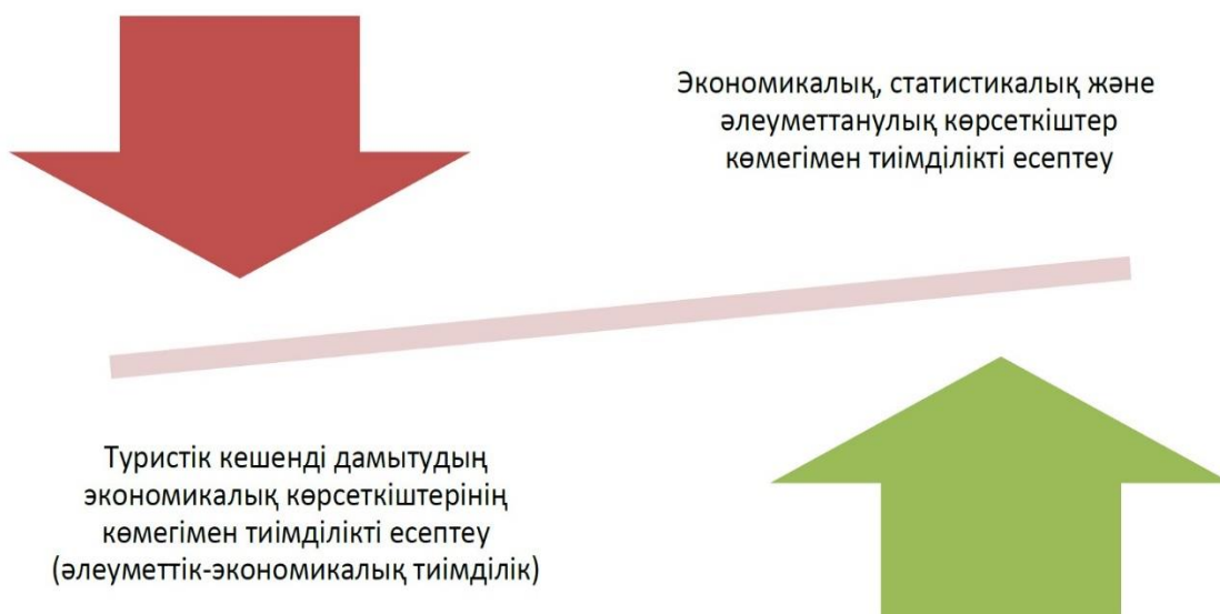
Сурет 4. Сыртқы туризмнің тиімділігін бағалау үшін қолданылатын негізгі тәсілдер

Бұл көрсеткіштер сыртқы туризмнің елдің қаржылық-экономикалық жағдайына әсері мен тиімділігіне тұтас баға береді.