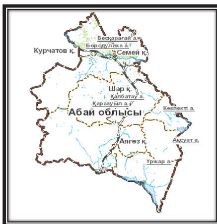
Сурет 2 - Абай облысының әкімшілік-территориялық картасы

Абай облысының туристік ахуалына талдау жасау үшін бұл аймақтағы негізгі орталықтардың туристік әлеуеттеріне тоқталу қажет (2-сурет).